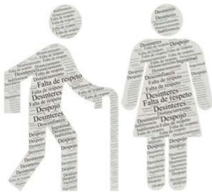
Gráfico 1 Percepción de viejismo por el Adulto Mayor

A partir de las historias de vida también se analizó como perciben los viejismos por parte de la familia a lo largo de las mismas se logran identificar en las narraciones para lo cual se construyó la siguiente imagen (Mesías y Haro:2022).