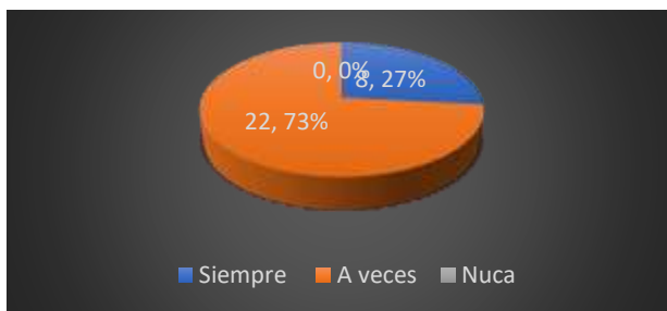
Figura 3. Incidencia de actos de violencia