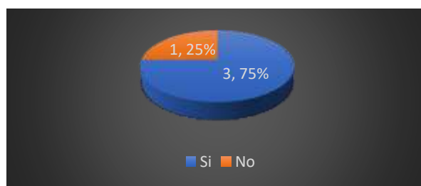
Figura 2. Incidencia de actos de violencia