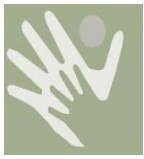
Tabla 1. Tipos y origen de discapacidad de los adultos mayores