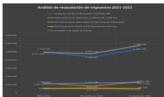
Figura 1. Análisis de la recaudación de impuestos 2021 y 2022

crecimiento significativo y alcanzó la meta establecida. El IVA Operaciones Internas también tuvo un aumento en la recaudación, mientras que el ICE Operaciones Internas y el Impuesto a la Salida de Divisas presentaron una disminución en sus recaudaciones.