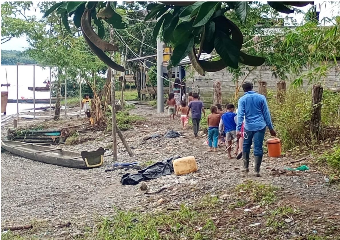
Figura 3. Fotografía tomada por los investigadores en Quibdó, Chocó (2024).

Familia y ancestros: No es recurrente encontrar el concepto de familia en la narrativa de los niños y jóvenes, dado que el contexto desplazamiento forzado ha implicado que