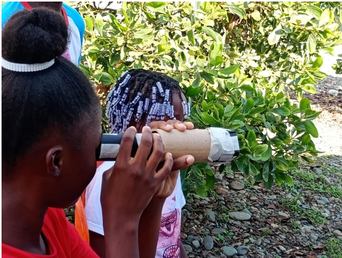
Figura 7. Fotografía tomada por los investigadores en Quibdó, Chocó (2024).

Esta dinámica implica una defensa desde lo Instituyente en la identidad ancestral; la cual permite una vida comunitaria y colectiva, de hermandad entre niños y jóvenes, la construcción de una historia ancestral que cohesiona comunitariamente la supervivencia en el territorio. Son los valores ancestrales los que se buscan forjar para la formación y una identidad y una estética cultural, donde los líderes sociales y comunitarios son referentes esenciales para la educación y el proyecto de vida en el auto reconocimiento de la historia colectiva y ancestral en la que sobreviven los menores. Este escenario involucra expresiones culturales correlativas que permiten la