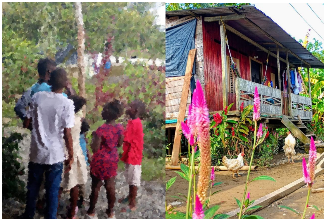
Figura 1. Fotografías tomadas por los investigadores en Quibdó, Chocó (2024).

b. Cumplimiento de la Política Pública en Quibdó, Chocó: Hinstroza & Cuesta (2024) estiman que el cumplimiento de la política pública es inexistente en el municipio de Quibdó, Chocó. Afirmación que se deriva de definir a las políticas públicas y de estimar el porcentaje de cumplimiento de los objetivos, de la misma. La Política pública es comprendida como un conjunto de acciones gubernamentales bajo las cuales se percibe una respuesta a necesidades de la población, identificando el ejercicio de actividades que permitan la protección y promoción de derechos; acompañadas de recursos económicos, gestiones operativas y estratégicas.