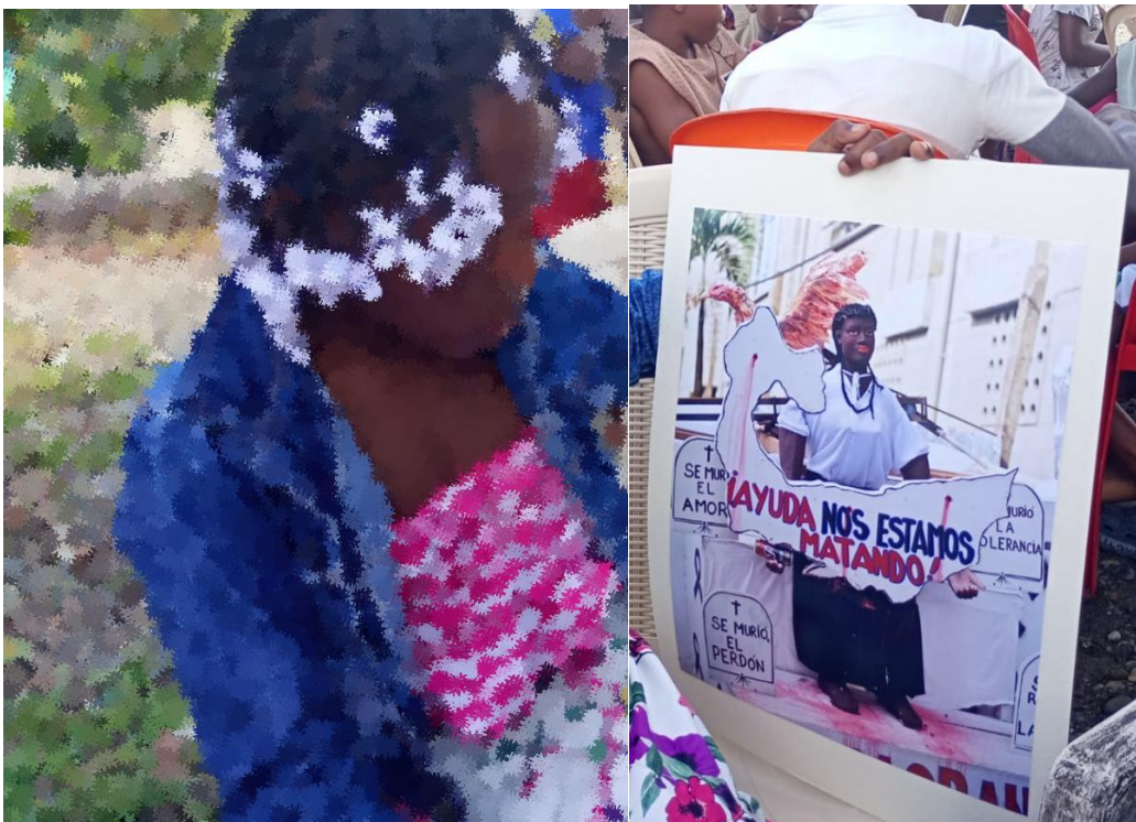
Figura 2. Fotografía tomada por los investigadores en Quibdó, Chocó (2024).

“Entre 2010-2014, el municipio de Quibdó, superó en inseguridad al país en términos de homicidio por cada 100.000 habitantes, con una brecha máxima hasta del (44%), para el año 2012, y una mínima del (10.7%) (...) En resumen, vale decir, que la población joven en Quibdó se ha visto vulnerable al reclutamiento forzado para integrar las bandas criminales como enlaces de las guerrillas y los paramilitares que se encuentran asentados en las zonas rurales del municipio, situación está que vulnera