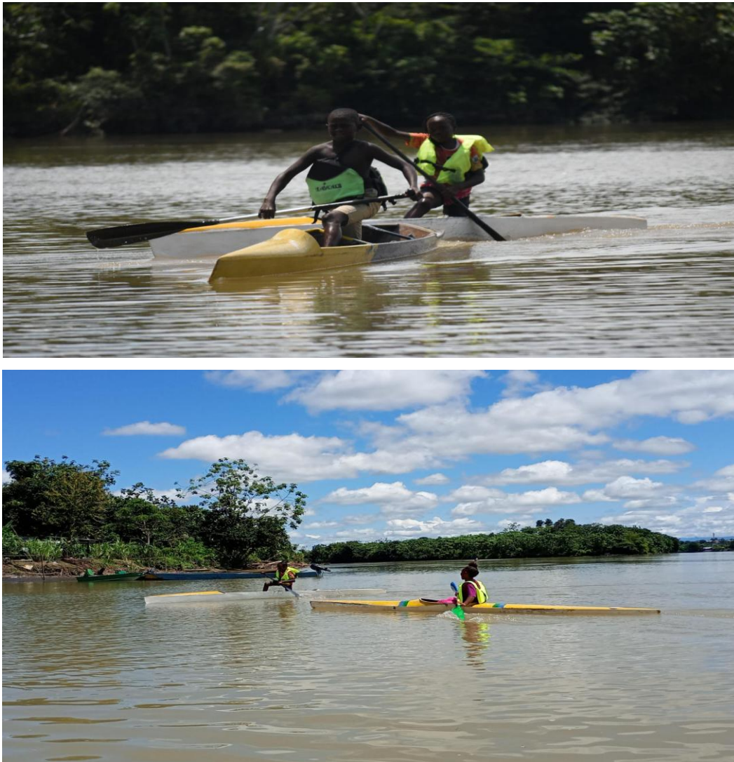
Figura 5. Fotografías tomadas por los investigadores en Quibdó, Chocó (2024).

La identidad estética aparece reiterativa por parte de los diversos artistas y líderes entrevistados, quienes han encontrado un refugio y una posibilidad de intercambio sociocultural con otros sectores de la población nacional e internacional. “Estamos en