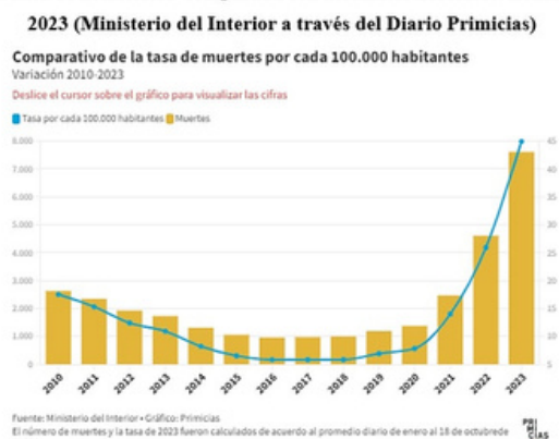
Figura 1. Tasa de homicidios comparada con asesinatos absolutos. Ecuador, 2009-2023